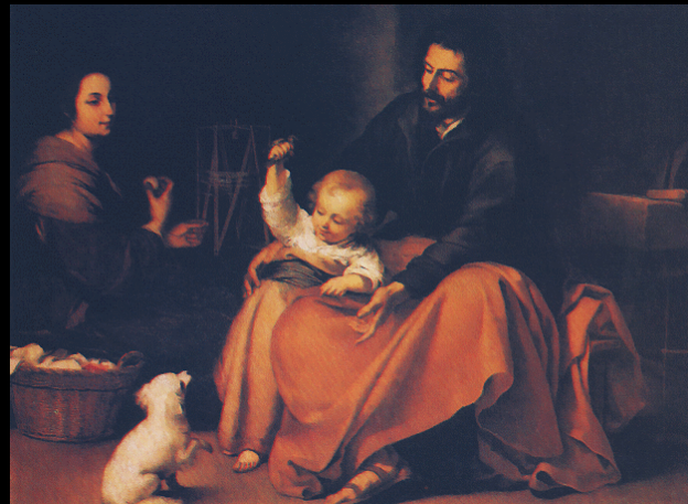
S. Familia del pajarito