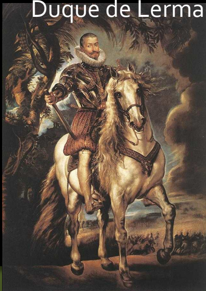
Duque de Lerma