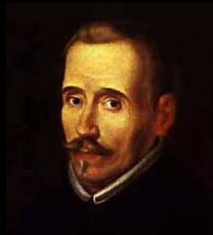
Lope de Vega